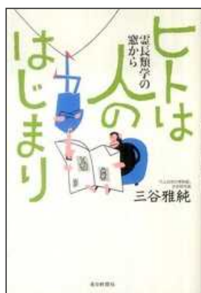
< 研究費購入分 >