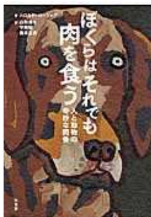
< 研究費購入分 >