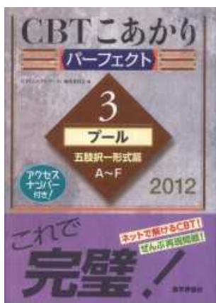
< 禁帯出資料 >