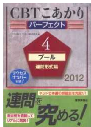
< 禁帯出資料 >