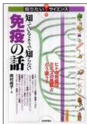
< 研究費購入分 >