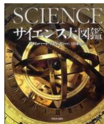
< 研究費購入分 >